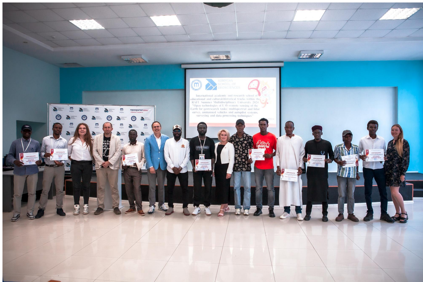
Сертификаты об окончании Летней школы Сибирской школы геонаук (SSG) ИРННТУ получили восемь студентов из стран Африки.