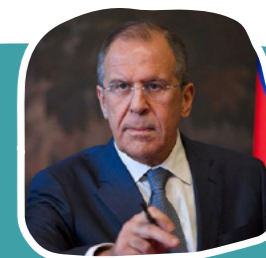
Сергей Лавров Министр иностранных дел России