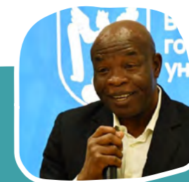
Эмека Акаэзува Вице-канцлер IUEA, проф.

Bien que l'aquaculture en Ouganda progresse, la pêche illégale continue de nuire au secteur, et certaines usines de transformation ont déjà fermé. Le pays vise un volume de production aquacole d'un million de tonnes et augmente la production d'alevins pour atteindre cet objectif.