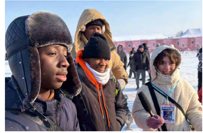
Африканские студенты ВоГУ стали участниками фестиваля настоящей русской тройки на Вологодчине