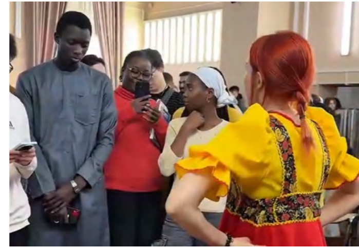
Spring arrives with pancakes: Maslenitsa at ROSBIOTECH