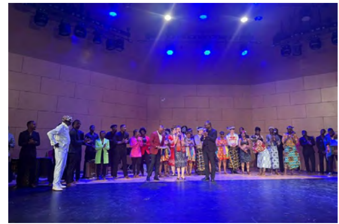
Первый российско-ивуарский концерт прошел в Государственном Дворце культуры Кот-д'Ивуара