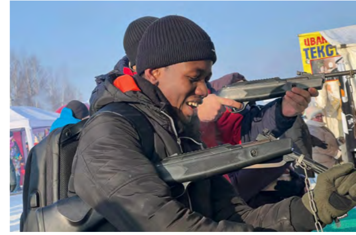
African students from Vologda State University took part in a festival celebrating authentic Russian troikas in the Vologda region