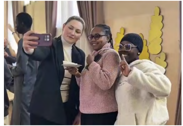
Весна приходит с блинами: Масленица в РОСБИОТЕХе