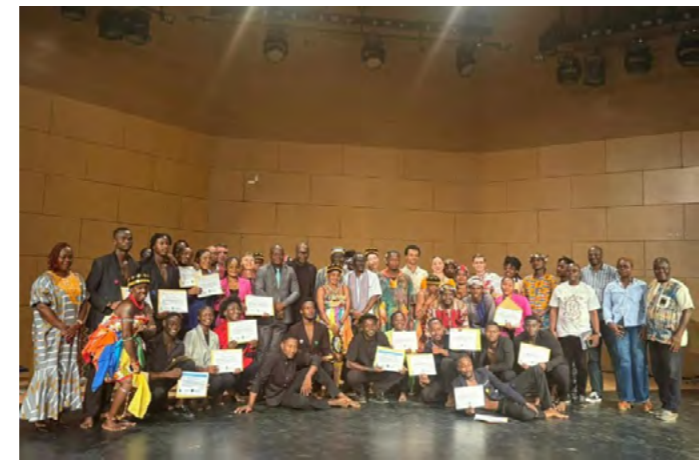
The first Russian-Ivorian concert took place at the State Palace of Culture in Côte d'Ivoire